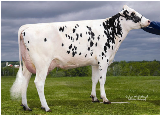
HENDEL BOLTON FLORIDA Granddam